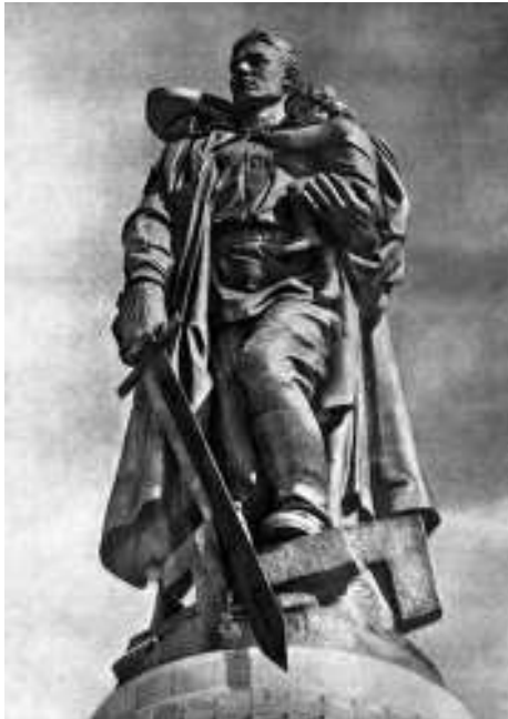
Е.В. Вучетич «Воин-освободитель»

Поздравляем читателей, всех охотников и рыболовов с 65-летием Великой Победы!