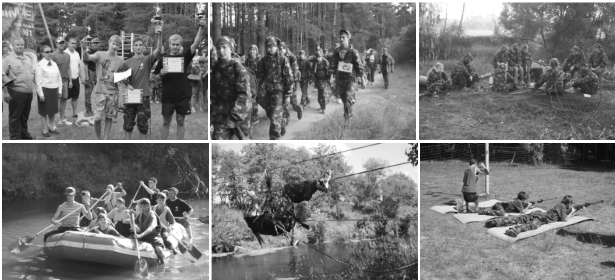
В молодежном лагере (Киржач)