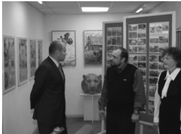
В музее охоты и рыболовства 27.10.2010