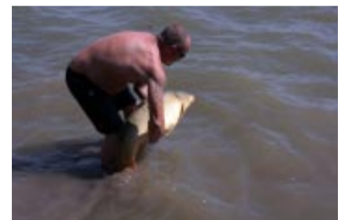
Туда и обратно...

18—21 июня с.г. на РСБ «Большая Волга» в Тверской области прошел 2-ой этап Кубка России по спортивной ловле рыбы спиннингом.