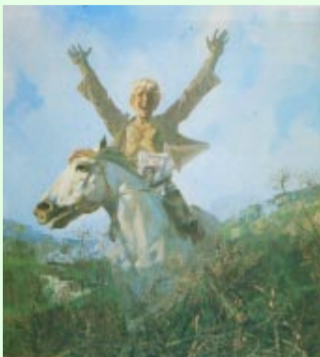
В.М. Харламов. Победа. 1985