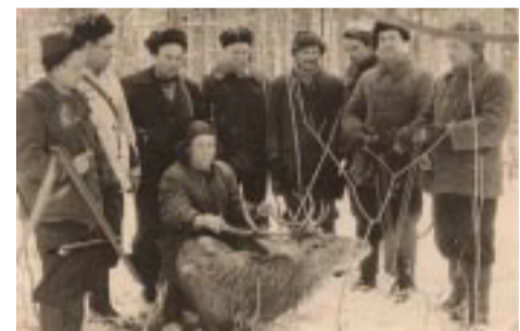
Группа охотников с добытым оленем. Июльское охотничье хозяйство. 1976 г.

В настоящее время Калининградское областное общество охотников и рыболовов насчитывает более 9,6 тыс. охотников, объединенных в 12 районных и городских организаций и клубов. В распоряжении общества и его подразделений — 31 охотничье хозяйство общей площадью 685,4 тыс. га, что составляет около 50% всех охотничьих угодий области. В 2001 г. ВНИИОЗ им. Житкова провёл охотустроительные работы во всех этих хозяйствах.